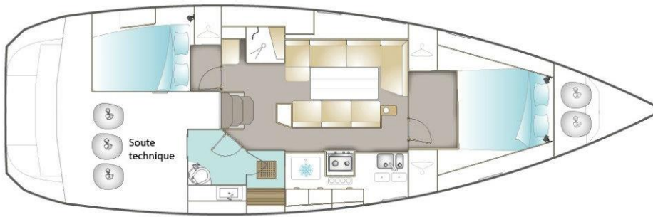
VERSION / DEUX CABINES DONT CABINE PROPRIÉTAIRE AVANT