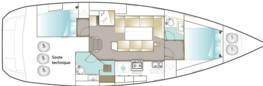
VERSION / DEUX CABINES DONT CABINE PROPRIÉTAIRE AVANT + SALLE DE BAINS (OPTION)