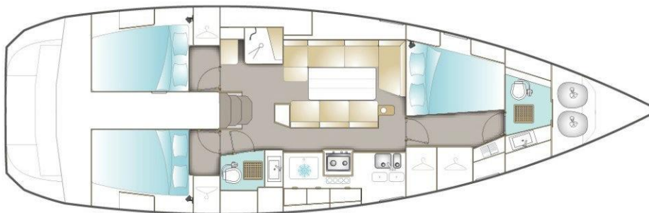
VERSION / FAMILLE / TROIS CABINES (OPTION)