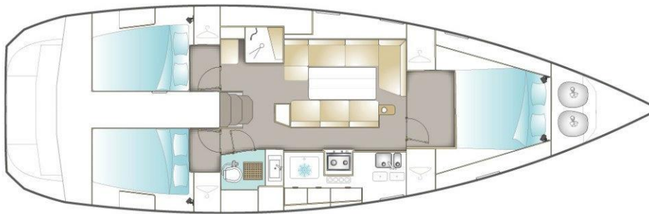
VERSION / FAMILLE AVEC CABINE PROPRIÉTAIRE AVANT (OPTION)